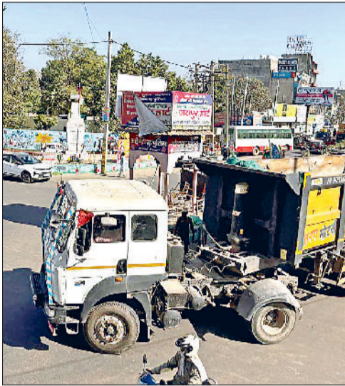
नारनौल। नो-एंट्री के बाजूद महावीर चौक पर भारी वाहन।