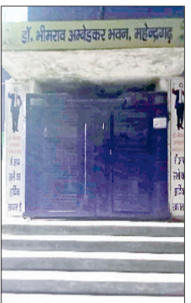
महेंद्रगढ़। डा. भीमराव अंबेडकर स्मारक समिति भवन।