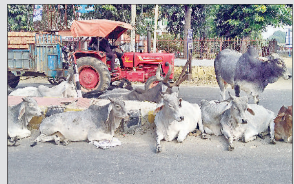
नारनौल। सड़क पर गोवंश।

उन्होंने बताया कि जिले में एक मॉनिटरिंग कमेटी का गठन कर दिया गया है। यह कमेटी विभिन्न सार्वजनिक स्थल तथा अधिक भीड़भाड़ वाले क्षेत्रों पर इस संबंध में कड़ी नजर रखेगी। इसमें विभिन्न विभागों के अधिकारी शामिल हैं। सीएमओ हॉस्पिटल में यह सुनिश्चित करने कि वहां पर आवारा कुत्ते ना घूमें। जीएम रोडवेज बस स्टैंड में यह सुनिश्चित करने तथा इसी प्रकार रेलवे विभाग के अधिकारी भी इस संबंध में कड़ी नजर रखेंगे। उन्होंने बताया कि जिला स्तर पर एक संयुक्त कार्य बल का गठन किया गया है। इसमें राष्ट्रीय राजमार्ग प्राधिकरण, लोक निर्माण विभाग, पशुपालन, पुलिस, विकास एवं पंचायत विभाग के प्रतिनिधि शामिल हैं। उन्होंने मुख्य मार्गों और राजमार्गों पर चौबीसों घंटे गश्त सुनिश्चित करने तथा बेसहारा पशुओं को हटाकर सुरक्षित स्थानों पर पहुंचाने के निर्देश दिए। उन्होंने स्पष्ट किया कि शहरी क्षेत्रों में नगर निकाय व ग्रामीण क्षेत्रों में पंचायत विभाग इन पशुओं को पकड़ने और चिह्नित गोशालाओं तक पहुंचाने के लिए उत्तरदायी होंगे। उन्होंने कहा कि सार्वजनिक स्थानों पर चौबीसों घंटे चलने वाले सहयता केंद्र संख्या हेलपलाइन 9306001570, 9416248495, 8307113197, 9467859544 व 01285225298 पर नागरिक अपनी शिकायतें दर्ज कर सकते हैं।