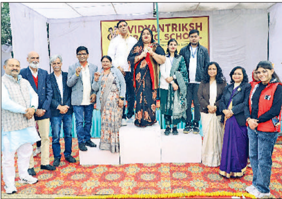
भिवानी। वार्षिक खेल उत्सव में विजेता अभिभावकों को पुरस्कृत करते अतिथि व वार्षिक खेल उत्सव की मटकी दौड़ स्पर्धा में भाग लेती विद्यार्थियों की अभिभावक व वार्षिक खेल उत्सव की बोरी दौड़ में भाग लेते विद्यार्थी।