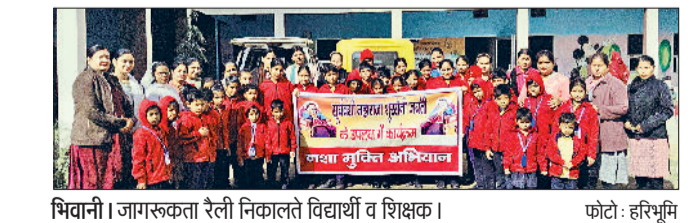
भिवानी। जागरूकता रैली निकालते विद्यार्थी व शिक्षक।

ढोबी तालाब के पास महाराजा शूरसैनी जयंती पर मेगा माईड स्कूल के बच्चों ने नशा मुक्ति हरियाणा जागरूकता अभियान का आयोजन किया। अभियान श्रीसैनी धर्मार्थ धर्मशाला एवं नवदुर्गा सेवा सहयोग संस्था के संयुक्त तत्वावधान में संपन्न हुआ। कार्यक्रम का मुख्य उद्देश्य समाज को नशे के दुष्परिणामों से अवगत