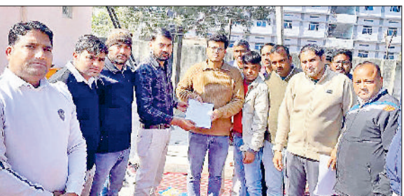
महेंद्रगढ़। एसडीओ को पत्र सौंपते कर्मचारी।

कुरहावाटा रोड स्थित बिजली निगम कार्यालय में सोमवार को एचएफईवी वर्कस यूनियन हेड कार्यालय भिवांनी के आह्वान पर ऑनलाइन ट्रांसफर पॉलिसी के खिलाफ कर्मचारियों ने दो घंटे विरोध प्रदर्शन किया। कर्मचारियों ने इस दौरान नारेबाजी भी की। इसके अलावा कर्मचारियों ने अपनी मांगों को लेकर एसडीओ का एक पत्र भी सौंपा। इस दौरान कर्मचारियों ने दो घंटे तक जोरदार प्रदर्शन कर पॉलिसी को वापस लेने की मांग की। धरना