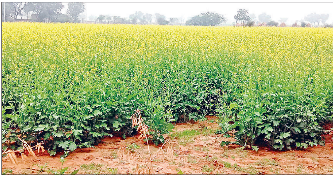
नारनौल। खेत में लहलहाती सरसों की फसल।

कुछ दिनों से जिले में रात्रि तापमान लगभग छह से सात डिग्री व दिन का तापमान 23 से 25 डिग्री के आसपास दर्ज किया जा रहा है, जो फसलों के लिए नुकसानदायक साबित हो सकता है।