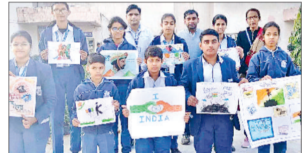
महेंद्रगढ़। बनाए हुए पोस्टर दिखाते विद्यार्थी।

यदुवंशी स्कूल में विजय दिवस पर देशभक्ति से ओत-प्रोत विभिन्न कार्यक्रम आयोजित किए गए। इस दौरान विद्यालय के छात्रों ने भाषण प्रतियोगिता, पोस्टर मेकिंग, देशभक्ति नारे तथा सांस्कृतिक गतिविधियों में भाग लिया। कार्यक्रम की शुरुआत शहीद सैनिकों को श्रद्धांजलि अर्पित करने के साथ हुई। छात्रों ने अपने भाषणों के माध्यम से युद्ध में वीर सैनिकों के अदम्य साहस, बलिदान और राष्ट्रप्रेम को भावपूर्ण शब्दों में प्रस्तुत किया। पोस्टर प्रतियोगिता में छात्रों ने देशभक्ति, वीरता और तिरंगे के सम्मान को सुंदर चित्रों के माध्यम से दर्शाया।